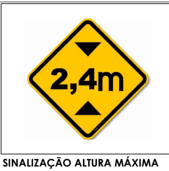
SINALIZAÇÃO ALTURA MÁXIMA